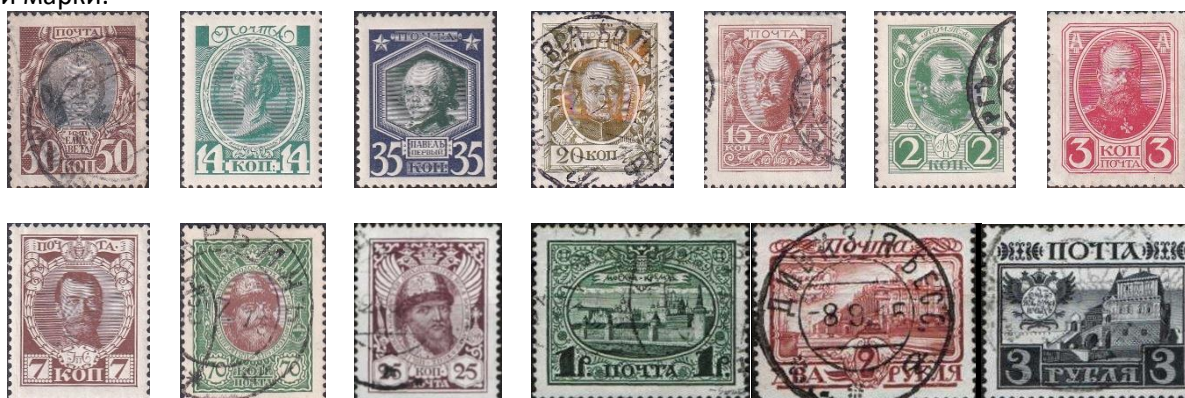
7. Марки потомков Петра I, 1913г.