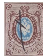
3. Марка Российской империи, 1-ый выпуск, 10.12.1857г.