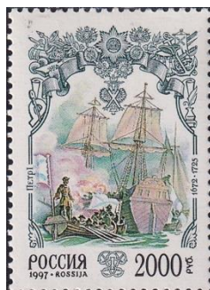
34. Марка Российской Федерации, строительство флота Петром I, 1997г.