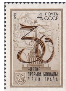
21. Марка СССР, к 30-летию прорыву блокады Ленинграда, 1973г.