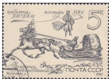
2. Марка СССР, почтовая кибитка первой почтовой линии, 1987г.

Первые почтовые марки Россией были выпущены 10.12.1857 года (марка 3), а стандартные марки выпущены в обращение в январе 1858 года (марка 4). Их тиражи сразу превысили десятки миллионов. На них до 1913 года размещались лишь изображения герба России и номиналов стоимости услуг связи (франкирование) в орнаментах. Это были, по существу, миниатюрные квитанции, отношение к которым было исключительно утилитарным. В Британии, Испании, Франции и в других странах на марках печатались изображения царствующих особ, портреты и прочие изображения, что придавало почте государственное значение и славил их великие владения. Россия избежала такого отношения как к почтовым маркам, так и к своим владениям.