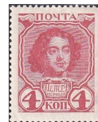
6. Марка Российской империи, портрет Петра I, к 300-летию династии Романовых, 1913г.