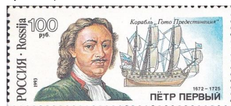
30. Марка российской Федерации, к 200-летию постройки в Архангельске первого линкора «Гото Предестинация», 1993г.

Пётр заложил несколько судов, сначала в Переславле, на Плещеевом озере, потом в Архангельске. 27 апреля (8 мая) 1700 год на воронежской верфи Воронежского адмиралтейства был спущен на воду 58-пушечный парусный линейный корабль « Гото Предестинация » («Божье провидение» или по лат. - «предопределение» (марка 30). Он строился по проекту русского царя Петра I под руководством корабельного мастера.