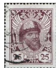
1. Марка Российской империи, портрет Алексея Михайловича, к 300-летию династии Романовых, 1913г.