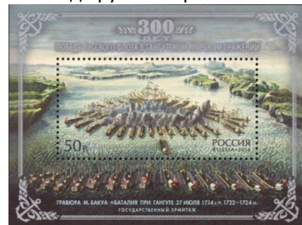
39. Блок марки Российской Федерации, к 300-летию победы Российского флота в сражении при Гангуте, репродукция гравюры М. Бакуа, 2014г.

Андреевский флаг - кормовой флаг кораблей Российского императорского флота и Военно-морского флота Российской Федерации. Представляет собой белое прямоугольное полотнище с синим (голубым) косым Андреевским крестом. Назван по имени апостола Андрея Первозванного, распятого, по преданию, на косом кресте. Флаг был учрежден в 1699 году, через год после учреждения ордена (марка 40). Официально о праве кораблей русского флота на Андреевский флаг было заявлено в 1703 году после занятия острова Котлин. С этого времени флагу с Андреевским крестом придавалось символическое значение выхода России к четырём морям — Белому, Балтийскому, Азовскому и Каспийскому.