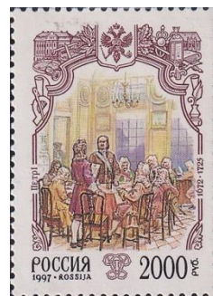
35. Марка Российской Федерации, административная реформа Петра I, Консилия министров, 1997г.