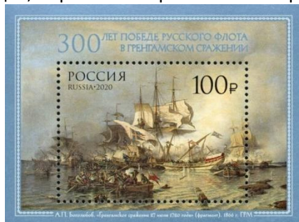
38. Блок марки Российской Федерации, к 300-летию победы Российского флота в Гренгамском сражении, репродукция картины А. П. Боголюбова, 2020г.

Гангутское сражение Северной войны состоялось 27 июля (7 августа) 1714 года у мыса Гангут (полуостров Ханко, Финляндия) в Балтийском море (марка 38) между русским армейским флотом и шведским отрядом из 10 судов, первая в истории России морская победа русского флота. В честь этого события 9 августа является одним из дней воинской славы России, в честь которого сооружен памятник на Пантелеймоновой улице. Сражение при Гренгаме произошло 27 июля (7 августа) 1720 года в Балтийском море около острова Гренгам (южная группа Аландских островов) и явилось последним крупным сражением Великой Северной войны (марка 39).