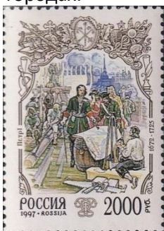
32. Марка Российской Федерации, строительство СПб Петром I, 1997г.

При Петре в 1703 году появилась первая книга на русском языке с арабскими цифрами («Арифметика» Леонтия Магницкого). В Москве была открыта 14 (25) января 1701 года школа математических и навигационных наук. В 1701-1721 годы были открыты артиллерийская, инженерная и медицинская школы в Москве, инженерная школа и морская академия в Петербурге, горные школы при Олонецких и Уральских заводах. В 1705 была открыта первая в России гимназия. Указом от 20 (31) января 1714 года созданы цифирные школы в провинциальных городах.