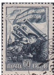
15. Марка СССР, защитим Ленинграда, 1942г.

Было выпущено лишь 6 отдельных марок (марки 15-18, 20, 21) и один квартблок марок с