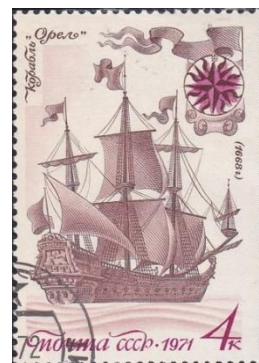
24. Марка СССР, первый военный корабль «Орел», построенный в деревне Дединово Коломенском уезде в 1668 году по указу царя Алексея Михайловича, 1971г.