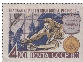
17. Марка СССР, медаль «За оборону Ленинграда» героям трудового фронта Ленинграда в 1941-1945гг., 1963г.