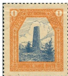
10. Марка земской почты Полтавского уезда к 200-летию Полтавского сражения, памятник погибшим шведам, 1909г.

В 1909 году было разрешено выпустить земские почтовые марки Полтавского уезда Полтавской губернии в честь 200-летия победы в полтавском сражении со Шведами (марка 9). Среди них марки с изображением памятников в Полтаве - памятник погибшим в Полтавском сражении шведам (марка 10). Установлен памятник в 1909 году на пожертвования шведов, а установка и