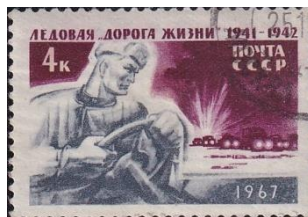
20. Марка СССР, героям «Ледовой дороги жизни» в 1941-1942 годы», 1967г.