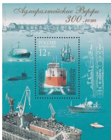
41. Блок марки Российской Федерации, к 300-летию основания Адмиралтейских верфей в Санкт-Петербурге, 2004г.

Георгиевский флаг в качестве кормового флага получили линейный корабль «Азов» (1827 год) и бриг «Меркурий» (1829 год). «Азѳв» - 74-пушечный парусный линейный корабль, флагман русского флота, герой Наваринского сражения , первый русский корабль, удостоенный кормового Георгиевского флага. «Азов», получивший своё имя в честь победы Петра I над турками в 1696 году. Ещё во время строительства в феврале 1826 года командиром корабля «Азов» был назначен знаменитый мореплаватель и первооткрыватель Антарктиды, капитан 1 ранга Михаил Петрович Лазарев.