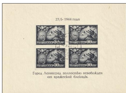
19. Квартблок марок СССР, к полному освобождению Ленинграда от блокады, учреждение медали «За оборону Ленинграда», 1944г.

отдельной маркой (марка 19), в память о блокаде Ленинграда в 1942 -1973 годы. На двух марках 1963 и 1944 годов изображена медаль «За оборону Ленинграда, учрежденная в 1942 году.