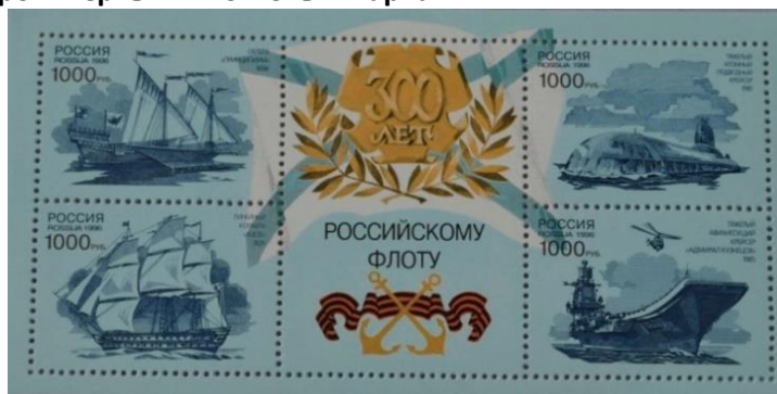
37. Блок марок Российской Федерации, к 300-летию Российского Военно-морского флота, 1996г.

Неудача 1-й азовской осады (1695 год), начатой без флота, ещё более показала его необходимость, и поэтому работы не прекращались даже в начале зимы, отличавшейся в тот год необычайной суровостью. Благодаря энергичной деятельности с присутствием самого царя к весне 1696 года было построено два корабля, два галеаса, 23 галеры и 4 брандера (марка 37). Главным начальником этого флота, в звании