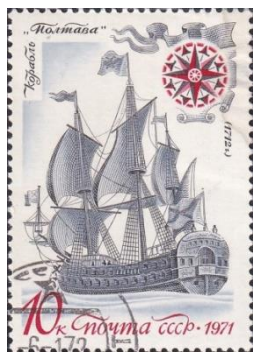
22. Марка СССР, первый корабль «Полтава», построенный в 1712 году в Санкт-Петербурге 1971г.

В 1971 году была все же выпущена серия марок в память о создании флота Петром Первым (марка 23, 24) и его отцом Алексеем Михайловичем (марка 22).