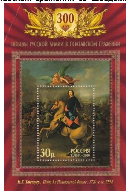
11. Блок-марки Российской Федерации, к 300-летию Полтавского сражения, 2009г.