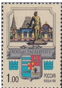
26. Марка Российской Федерации, к 300-летию основания Таганрога, памятник Петру Первому, 1998г.