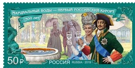
29. Марка Российской Федерации, к 300-летию основания Петром Первым первого курорта в России «Марциальные Воды», 2019г.