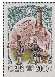
36. Марка Российской Федерации, реформы образования Петром I, навигационная школа, 1997г.