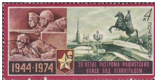
14. Марка СССР, к 30-летию снятия блокады Ленинграда, 1974г.

Лишь в 1953 и 1957 годах в СССР были выпущены серии марок в честь 250-летия Ленинграда с изображением памятника Петру Первому - «Медный всадник» и прочих достопримечательностей города (марки 12 и 13).