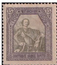
9. Марка земской почты Полтавского уезда к 200-летию Полтавского сражения, 1909г.