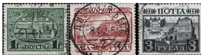
8. Марки с видами Кремля, Зимнего, дома Романовых, 1913г.