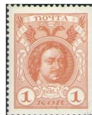
5. Марка Российской империи, портрет Петра I, к 300-летию династии Романовых, 1913г.

В 1913 году в России праздновалось трёхсотлетие династии Романовых. В честь этого юбилея по заказу Главного управления почт и телеграфов 1 января 1913 года была выпущена первая и единственная коммеморативная (памятная) серия почтовых марок Российской империи. На миниатюрах были изображены портреты монархов дома Романовых: 1 и 4 копейки — Пётр I (с гравюры Луи Сент-Обена (марка 5) и картины Г. Кнеллера, соответственно (марка 6), Александр II, Александр III, Екатерина II, Александр I, Алексей Михайлович, Павел I, Елизавета, Михаил Фёдорович. Для трёх марок были взяты фотографии панорамы Московского Кремля, Зимнего дворца в Санкт-Петербурге и дома бояр Романовых в Зарядье в Москве. Портрет правящего в то время императора Николая II был помещён на три марки.