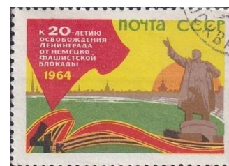
18. Марка СССР, к 20-летию освобождения Ленинграда от немецко-фашистской блокады, 1964г.

отдельной маркой (марка 19), в память о блокаде Ленинграда в 1942 -1973 годы. На двух марках 1963 и 1944 годов изображена медаль «За оборону Ленинграда, учрежденная в 1942 году.