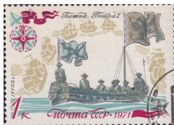
23. Марка СССР, ботик Петра I, построенный в 1723 году, 1971г.