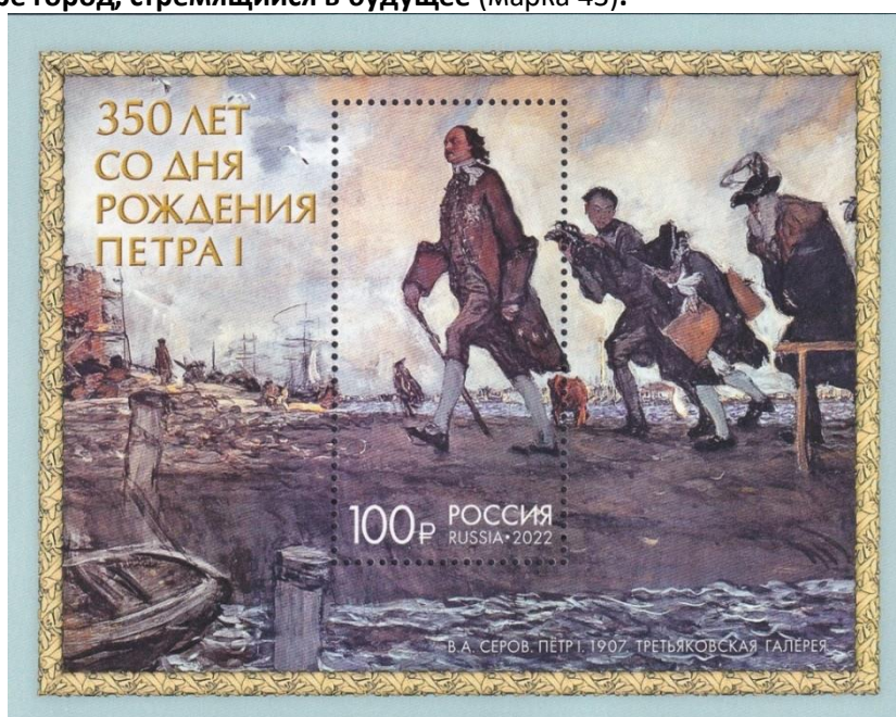
43. Блок-марка России, к 350-летию со дня рождения Петра Первого, 2022г.

Санкт-Петербургу – еще одному детищу Петра Первого, удалось вернуть лишь 6 сентября 1991 года имя, данное основателем, воссоздать из руин и забвения, превратив в великолепный и лучший в мире город, стремящийся в будущее (марка 43).