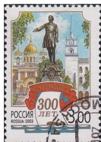
27. Марка Российской Федерации, к 300-летию основания Петрозаводска, памятник Петру Первому, 2003г.