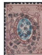
4. Марка Российской империи, 1-ый стандартный выпуск, январь 1858г.

За дореволюционный период в России за почти 60 лет было выпущено 379 марок, а также Земской почтой 162 уздами -1286 марок, в Советское время за 70 лет – 7439 марок, а в Российской Федерации за 30 лет – 5347 марок.