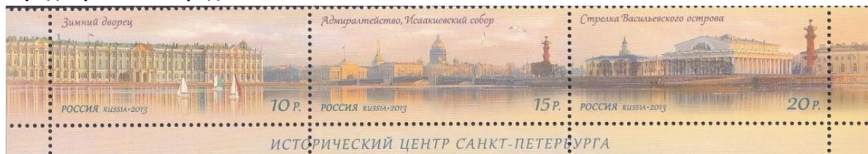
42. Сцепка марок Российской Федерации, панорама исторического центра С.-Петербурга, 2013г.

Советская власть предала забвению свершения Петра Первого и его потомков. С огромным трудом Советской власти удалось сохранить унаследованную ими страну и Великий город - Санкт-Петербург (марка 42), переименовав в 1924 году детище Петра Первого в «город трёх революций, город-герой Ленинград».