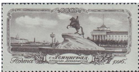
12. Марка СССР, к 250-летию Ленинграда, 1953г.