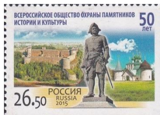
28. Марка Российской Федерации, к 50-летию создания Общества охраны памятников истории и культуры, основания Петергофа, памятник Петру Первому в Петергофе, 2015г.