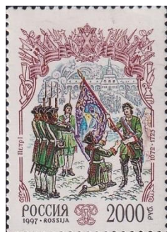
33. Марка Российской Федерации, реформа армии Петром I, 1997г.