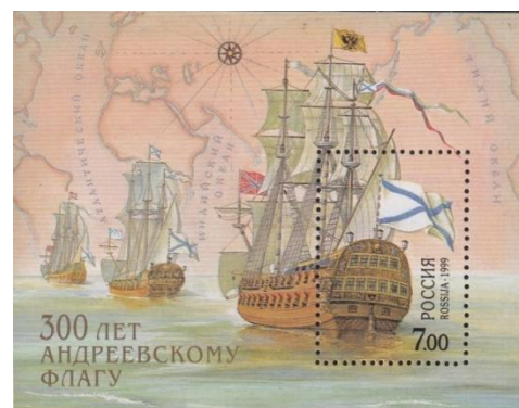
40. Блок марки Российской Федерации, к 300-летию учреждения Андреевского флага, 1999г.

За выдающиеся подвиги почётное право носить