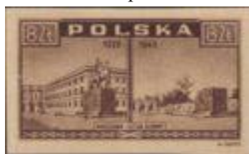
95.Марка Польши о разрушении Варшавы в 1946г. к 1939г.