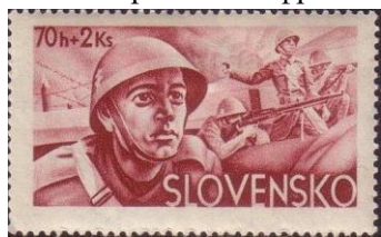
79. Марка Словакии, боевые действия в Беларуси, 1943г.

В войне против СССР погибло около 3,5 тысяч словаков . Словацкие солдаты и офицеры на советско-германском фронте целыми частями переходили на советскую сторону.