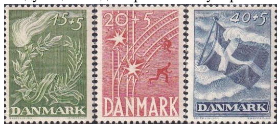
56. Серия марок Дании, в память сопротивления оккупации - газета «Frit Danmark», саботаж на железных дорогах и потопление флота датскими моряками, 1947г.

Причиной таких действий Дании была в том, что в сентябре 1939 года Дания подписала договор о ненападении с нацистской Германией и объявила о своём нейтралитете, однако в апреле следующего года Германия оккупировала страну.