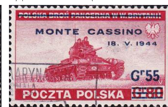
88.Марка Польского правительства в Лондоне в память о сражении при Монте-Кассино, 1944г.