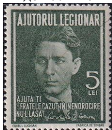
8. Марка Румынии, К.Кодряну, 1940г.