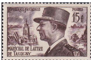
50. Марка Франции, к 20-летию смерти генерала Жана де Латр де Тассиньи, посмертного маршала Франции, 1972г.