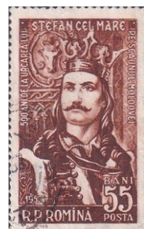
16. Марка Румынии, к 500-летию Молдавского господаря Стефана III Великого, 1957г.

Отсюда происходит убеждение Румынии в военных решениях своих проблем по присоединению чужих территорий с помощью сомнительных союзников.