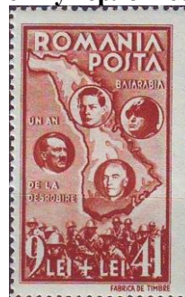
10. Марка Румынии для решения «Оси» по Бессарабии, 1941г.