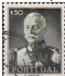
34. Марка Португалии, А. Кармане, 1945г.