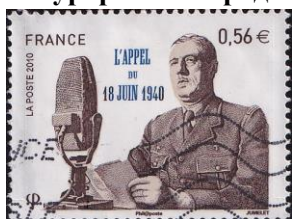
53. Марка Французской республики, к 70-летию обращения ген. Де Голя к нации, 18.06.1940г., 2010г.

Соглашение о перемирии, заключённое 22 июня 1940 года генералом Жаном де Латр де Тассиньи (марка 50), положило конец боям во Франции. Депутаты парламента 11 июля собрались в курортном городке Виши на юге Франции и передали власть маршалу Филиппу Петену (марка 51).