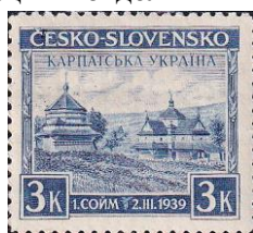
72. Марка Чехословакии для оккупированной Карпатской Украины, 1939г.