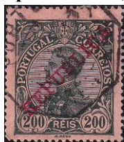
33. Марка королевства Португалии для республики, 1910г.

В период первой республики - с 1910 по 1926 год сменилось 44 правительства, произошло 24 восстания, 158 всеобщих забастовок, 17 попыток государственного переворота с участием недовольных военных. Конец республике положил военный переворот 1926 года, установивший репрессивный авторитарный режим почти на пять десятилетий. Руководство страной перешло к генералу Антониу Оскару ди Фрагушу Кармоне. А.Кармоне сначала стал временным президентом, а затем четырежды переизбирался президентом и умер на этом посту в 1951 году