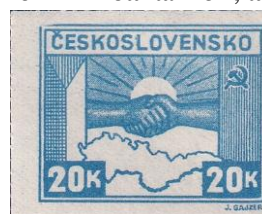
73. Марка Чехословакии, о воинском Содружестве с Красной Армией, 1945г