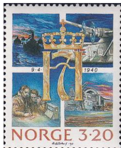
58. Марка Королевства Норвегия к 50-летию битвы трех флотов за порт Нарвик, 1990г.