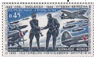
54. Марка Франции, к 25-летию эскадрильи «Нормандия-Неман», 1969г.

Правительство Виши удерживало контроль над 2/5 территории страны - центральными и южными районами. Германские войска оккупировали весь север с Дюнкерком и атлантическое побережье (марка 52).