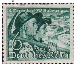
70. Марка Германского Рейха о присоединении Судет, 1938г.

В Советском Союзе 5 января 1942 года в Бузулуке началось формирование из чехословаков первой воинской части - 1-й чехословацкий отдельный пехотный батальон , а уже 1 марта 1943