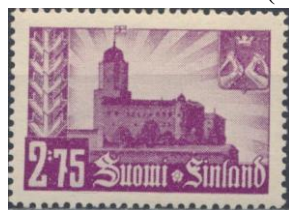
66. Марка Финляндии к оккупации Выборга, 1941г.