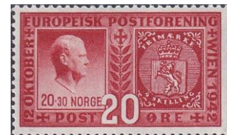
61. Марка оккупированной Германией Норвегии, глава «Национального правительства» Видкун Квислинг, 1942г.