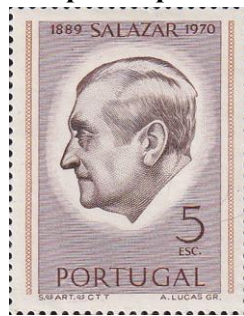
35. Марка Португалии, А. Салазар, 1971г.