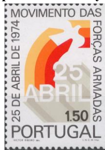
36. Марка Португалии, к революции 25 апреля, 1974г.

(марка 34). В 1928 году А.Кармоне пригласил министром финансов Антониу ди Оливейру Салазара, который фактически управлял Португалией с 1932 по 1968 год, исполняя обязанности президента Португалии лишь с 18 апреля по 21 июля 1951 года (марка 35).