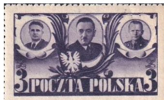
101. Марка Польши, к итогам Народного референдума, Э. Осубка-Моравский, Б.Берут, М.Рола-Жимерский, 1946г.