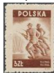
96.Марка Польши о содружестве с Красной Армией, 1945г.