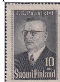
69. Марка Финляндии, президент Ю. Паасикиви, 1947г.

Выборг и Петрозаводск. К началу октября 1941 они заняли почти всю территорию Карелии, включая Выборг (марка 66), кроме побережья Белого моря и Заонежья (марка 67), после чего перешли к обороне на достигнутых рубежах.