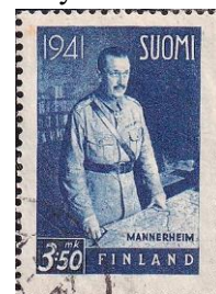
68. Марка Республики Финляндия, Густаву Маннергейму в Миккели, 1941г.