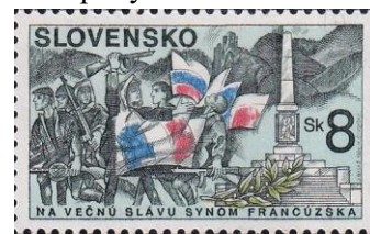
82. Марка Словакии, к 50-летию Словацкого восстания, 1994г.

Причиной таких действий Словакии была проигранная Первая Мировая война Австро-Венгерской империей и её распад. Словакия входила в состав империи вместе с Чехией. В 1918 году образовалось суверенное Чехословацкое государство. Венгерская Советская республика захватила часть Словакии в 1919 году, но вскоре вынуждена была уйти с захваченных территорий, спровоцировав борьбу автономий в Чехословакии (Прикарпатскую Русь, Словацкое государство и т.д.). После заключения Мюнхенского соглашения, 6 октября 1938 года союзник Гитлера Йосиф Тисо объявил независимость Словацкого государства (марка 80). В 1940 году в Словакии была