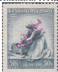
76. Марка Чехословакии для немецкой оккупации Судетенленда, 1938г.