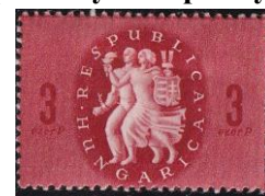
23. Марка Венгерской республики, марки руководства социалистической республики, 1946г.

которая 18 марта 1939 г. была оккупирована Венгрией до 1945 года (марка 19). 1 июля 1941 года Венгрия направила на войну против СССР «Карпатскую группу» (5 бригад, общей численностью 40 тысяч человек), воевавшую в составе немецкой 17-й армии на Украине . К ноябрю 1941 их