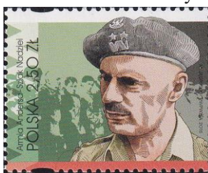
86.Марка Польши в память о генерале В.Андерсе, 2016г.