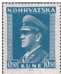
25. Марка Независимого Хорватского государства, през. А.Павелич, 1944г.

легион» (он же «добровольческий хорватский полк»), созданный по инициативе Муссолини. В него входили 3 пехотных батальона и 1 артбатальон, общей численностью 3,9 тысяч человек. В октябре 1941 полк прибыл на фронт на Донбасс, а в 1942 – в Сталинград (марка 24). К февралю 1943 хорватский полк был практически уничтожен, в советский плен было взято около 700 хорватов. В войне против СССР погибло около 2 тысяч хорватов.