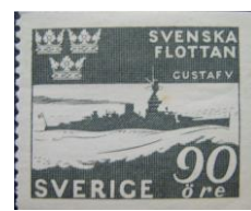
63. Марка Швеции, шведский флот вышел в море 1944г.,

Причиной таких действий Швеции состояла в том, что Шведский парламент вместе с Норвегией и Финляндией в 1939 году отклонил заключение пакта о ненападении с гитлеровской Германией, однако высказался против применения санкций в отношении агрессора и отвечал на угрозы Германии «заявлением о нейтралитете». Исторически сложившееся недружелюбие к России, в память поражений от неё и к «большевистскому» Советскому Союзу, привело Швецию к политике маневрирования между немецким агрессором и «опасным» соседом на Востоке, что фактически сделало её участником войны.