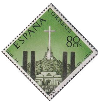
31. Марка Испании, открытие мемориала «Долина Павших», 1959г.

Война завершилась в 1939 году взятием Мадрида мятежниками и установлением пожизненной диктатуры фашистского режима каудильо Франсиско Франко до