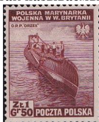
89.Марка Польши (Прав. в Лондоне), подлодка Британии, 1944г.

Война против СССР. В период с 28 июня 1944 до 30 мая 1945 года членами созданной Польским Правительством в Лондоне Армии Крайовы (марка 90) было убито 594 и ранено 218 советских военнослужащих. В общей сложности членами Армии Крайовы было убито около 1000 советских военнослужащих . В Польше до наших дней чтут память Армии Крайовы (марка 91) и так называемых «проклятых солдат» войны (марка 62).