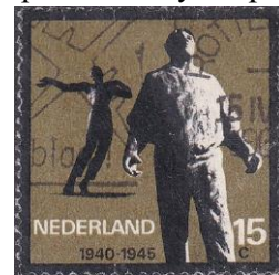
45. Марка Нидерландов, к 20-летию борьбы за свободу, 1965г.

войск СС «Нидерланды» (в составе двух моторизованных полков и других подразделений, общей численностью 9 тысяч человек). В 1944 году один из полков нидерландской бригады был