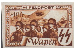
39. Марка бельгийского легиона войск СС, 1941г.