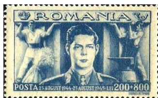
13. Марка Румынии, «социалистический» король Михай I, освобожденный труд 1 мая, 1945г.