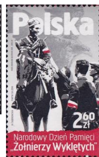
92. Марка Польши, «проклятые солдаты», 2019г.

На Восточном фронте. В мае 1943 года по инициативе «Союза польских патриотов» и при поддержке со стороны советского правительства на советской территории началось формирование новых польских воинских частей: сначала 1-й польской пехотной дивизии им. Тадеуша Костюшко (марка 93), а позднее - и иных польских воинских частей и подразделений. В январе 1944 года польский корпус был отправлен в район Смоленска. 13 марта 1944 Ставка решила развернуть польский корпус в 1-ю армию Войска Польского (марка 94). Для этого корпус был передислоцирован на Украину, в район города Сумы, здесь численность польской армии была доведена до 78 тысяч. Летом 1944 года в состав 1-й армии входили 4 пехотные и 1 зенитно-артиллерийская дивизии, 1 бронетанковая, 1 кавалерийская, 5 артиллерийских бригад, 2 авиаполка и другие части. Численность личного состава в это время составляла около 90 000 человек. Польские части участвовали в освобождении Польши, включая Варшаву (марка 95).