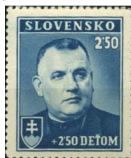
80. Марка Словакии, през. И.Тисо, 1939г.