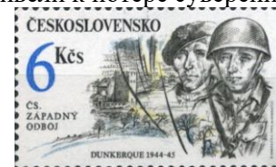
78. Марка Чехословакии, к участию в войне на Западном фронте, совместно с Францией, 1942г.

Правительство Чехословакии заключило оборонительные договоры с Францией в 1924 году и с Советским Союзом в 1935 году. Первый президент страны Т.Масарик умер в 1935 году. Его