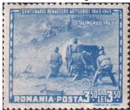
6.1. Марка Румынии, участие в боях под Сталинградом, 1943г.

1942 года перешли в наступление и 23 ноября образовали кольцо окружения вокруг Сталинграда. В кольцо оказались 6-я немецкая армия, часть войск немецкой 4-й армии, 6 пехотных и 1 кавалерийская румынская дивизия. К концу января 1943 3-я и 4-я румынские армии были практически уничтожены – их общие потери составили почти 160 тысяч погибшими, пропавшими и ранеными (маркаб.1). В начале 1943 года 6 румынских дивизий общей численностью 65 тысяч человек, в составе 17-й немецкой армии, воевали на Кубани , а в сентябре 1943 эти войска ступили в Крым . В апреле-мае 1944 года советские войска освободили Крым ; при этом румынские войска в Крыму потеряли более трети личного состава.