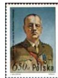
85. Марка Польши, к 100-летию рождения В.Сикорского, 1981г.

В феврале 1942 года правительство СССР обратилось к польской стороне с просьбой об отправке на фронт 5-й пехотной дивизии, обучение которой к этому времени было завершено. Однако, В. Андерс отверг возможность ввода в бой одной отдельной дивизии, принятое им решение поддержал В. Сикорский. В марте 1942 года правительство СССР сообщило, что в связи с осложнением положения с продовольствием в СССР, количество продовольственных пайков для польских воинских частей в СССР, не принимающих участия в боевых действиях, будет уменьшено до 44 тысяч. 1 сентября 1942 года эвакуация армии Андерса была закончена. В общей сложности, в ходе двух эвакуаций из СССР выехало 75 491 военнослужащих и 37 756 гражданских лиц.