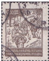
26. Марка ДФ Югослави, партизаны, 1945г.

концлагерях более 2,5 млн сербов, несколько сот сербов насильно обращали в католичество, сотни тысяч сербов было убито.