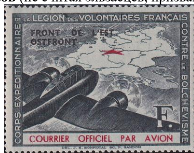
47.Марка Французского добровольческого легиона на Восточном фронте, 1944г.