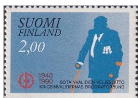
64. Марка Финляндии, к 50-летию «Зимней войны», 1990г.

Финляндии кроются в заблуждении того, что военные решения своих проблем возможны с помощью сомнительных союзников. Получив независимость от Советской России в декабре 1917 года, страна решила строить свой суверенитет по пути избавления от проблем прошлого развития, ошибочно надеясь на внешнюю помощь союзников. Однако, в начале этого строительства Финляндии пришлось пережить гражданскую войну с последователями большевиков, что привело к национализму страны (марка 64.1). Финляндии удалось наладить хорошие отношения с Советским Союзом только после войны, сохранить свою политическую систему и развивать торговлю с западными странами. Это явилось результатом политической линии президентов