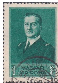
22. Марка Венгрии, регент М.Хорти, 20 лет у власти, 1938г.