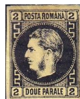
15. Марка Княжества Румыния, король Кароль I, 1866г.