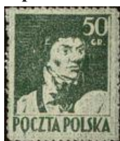
93.Марка польши, Тадеуш Костюшко, 1944г.

Вклад польских воинов в победу получил высокую оценку: более 5 тысяч военнослужащих и 23 соединения и части Войска Польского были награждены советскими орденами и медалями (марка 96). Войско Польское 13 раз было отмечено в приказах Верховного