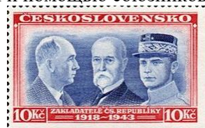
77. Марка Чехословацкого Правительства в изгнании, в Лондоне, Э.Бенеш, Т.Масарик, М.Штефаник, 1943г.