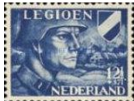
42. Марка Нидерландов для добровольческого легиона, 1941г.

В мае 1943 года нидерландский легион был переформирован в добровольческую бригаду