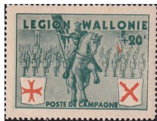
38. Марка Валлонского легиона войск СС, 1941г.