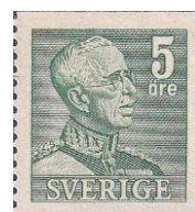
62. Марка Швеции, король Густав V, 1941г.

В Балтийском море, по данным командующего КБФ адмирала В. Трибуца, каждая советская подводная лодка, возвратившаяся на базу в кампанию 1942 года, в течение одного боевого похода имела в среднем 4 боевых столкновения с кораблями и самолётами шведских ВМС (марка 63). В середине августа 1943 года Швеция прекратила перевозку немецких военных материалов через свою страну. Шведы поставляли немцам подшипники, железную руду, сталь, редкоземельные элементы. Они фактически питали немецкий ВПК до конца 1944 года. В период Великой Отечественной войны Швеция была дипломатическим посредником между СССР и Германией.