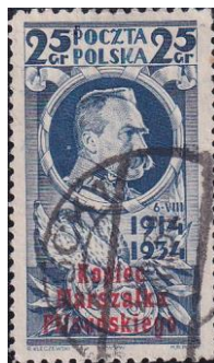
100. Марка Польши, к смерти Ю.Пилсудского, 1935г.