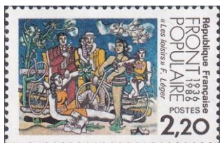
49. Марка Франции, к 50-летию создания Народного Фронта, 1986г.

В июле 1934 года социалисты и коммунисты договорились действовать вместе против рвавшегося к власти фашизма. Позже к этому блоку присоединились и радикалы. Заключили 14 июля 1935 года соглашение о создании политического союза под названием «Народное объединение», более известное под названием «Народный фронт» (фр. Front populaire). Выиграв парламентские выборы в мае 1936 года, Фронт находился у власти до 1937 года и сформировал первое левое правительство, которое возглавил социалист Леон Блюм (марка 49).