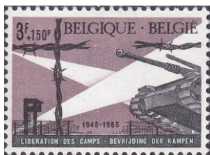
41. Марка Бельгии, к 20-летию освобождения от оккупации, 1965г.

Причина таких действий Бельгии была в том, что она не смогла сохранить суверенный статус нейтралитета, поддерживая экономическую зависимость от агрессивных соседей, и была первой страной, оккупированной Германией в начале Первой Мировой войны. В 1936 году Бельгия возобновляет политику нейтралитета и снова попадает в ту же ловушку. В мае 1940 года немецкие войска вновь за 2 недели захватывают Бельгию, совершив прорыв через горы Арденны, в неожиданном для союзников месте (марка 40). Король Леопольд III 28 мая 1940 года подписывает акт о капитуляции. Правительство страны бежит в Британию, короля депортируют в Германию, в