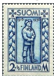
64.1. Марка Финляндии, 20 лет окончания гражданской войны, 1938г.