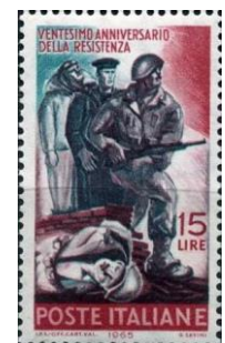
18.1. Марка Италии, к 20-летию антифашистам, 1965г.

Всего в созданном для войны с СССР корпусе было 62 тысячи солдат и офицеров. Корпус был отправлен на южный участок немецко-советского фронта (через Австрию, Венгрию,