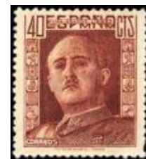
29. Марка Испании, генерал Франко, 1942г.

Причиной таких действий Испании была уверенность в военных решениях своих проблем с помощью сомнительных союзников. Некогда могущественное Королевство Испания не смогло пережить несколько поражений в войнах с французскими, британскими и американскими соперниками и потерю почти всех своих многочисленных колоний, на эксплуатации которых строилась её экономика. После массовых выступлений 14 апреля 1931 года монархия была свергнута и Испания вновь стала республикой. Неспособность республиканской власти решить экономические проблемы без терроризма в стране привела к росту популярности армии Испанской Фаланги. Это привело к мятежу фалангистов в 1936 году и к развязыванию ими кровопролитной гражданской народной войны, с участием войнов-интернационалистов.