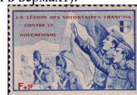
48.Марка Французского легиона войск СС, 1941г.