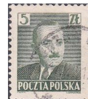
102. Марка Польши, през. Б.Берут, 1947г.

переименованы в Польский вспомогательный корпус под командованием Юзефа Пилсудского. В июне 1916 года в легионах было около 25 тысяч человек.