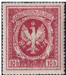
98. Марка Польского легиона, 1916г.

Ранее, в 1914-1918 годах в Польше появились националистические Польские легионы - польские формирования армии Австро-Венгрии, принимавшие участие в Первой мировой войне (марка 98). Легионы участвовали в боях в Галиции и в Карпатах. Позже легионы были