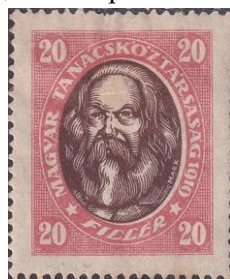
21. Марка Венгерской Советской Республики. К.Маркс, 1919г.