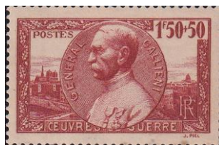
51. Марка Франции, маршал Ф. Петен, 1940г.