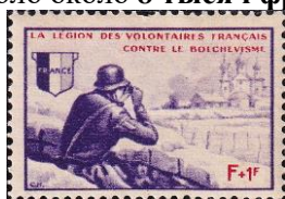
46.Марка Французского добровольческого легиона, 1941г.

3 француза были награждены немецкими Рыцарскими крестами. В войне против СССР погибло около 8 тысяч французов (не считая эльзасцев, призванных в вермахт).