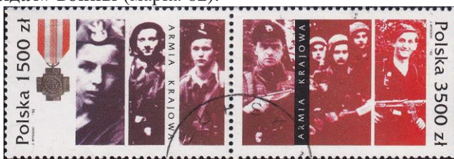
91.Марка Польши к 50-летию Армии Крайовы, 1992г.