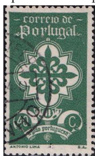
32. Марка Португальского легиона, 1940г.

Португалия. С сентября 1939 года Португалия объявила о своём нейтралитете и сохраняла его на протяжении всей войны . Однако, с 1943 года она сдавала Британии в аренду морские базы на Азорских островах. С 1941 года существовал и добровольческий легион СС, около 1000 чел. из которого воевали на Восточном фронте в составе дивизии Испанского легиона . Страна также торговала вольфрамом на обе стороны.