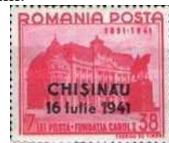
6. Марки Румынии для оккупированного Кишинёва, 1941г.

Эти территории попали под контроль румынских властей. На них были учреждены Буковинское губернаторство (марка 3) под управлением М. Риошяну, Бессарабское губернаторство (марка 4) под управлением К. Войкулеску и губернаторство Транснистрия (марка 5) под управлением Г. Алексяну. Столицей Буковинского губернаторства стали Черновцы (марка 7), а Транснистрии – сначала Тирасполь, а потом Одесса. Войска двух советских фронтов 19 ноября