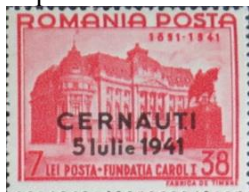
7. Марка Румынии для оккупированных Черновцов, 1941г

23 августа 1944 года в Румынии был произведён государственный переворот, и румынская армия стала воевать вместе с Красной Армией против Германии и Венгрии . Всего в войне против СССР погибло до 200 тысяч румын (из них 55 тысяч умерло в советском плену) .