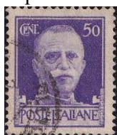
17. Марка Италии, кор. Виктор-Эммануил III, 1929г.

Италия. Италия объявила войну СССР 22 июня 1941 года. Мотивация – инициатива Муссолини, ещё в январе 1940 года предлагавшего «общевропейский поход против большевизма». При этом территориальных притязаний на какую-либо зону оккупации СССР у Италии не было.