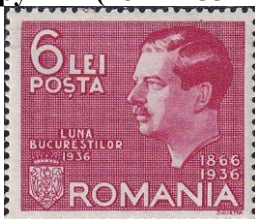
9. Марка Румынии, король Кароль II, 1936г.