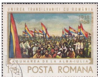
12. Марка Румынии, к 50-летию присоединения Трансильвании, 1968г.

Войска Румынии с августа 1944 года перешли на сторону Советского Союза и вместе с ним воевали - с вермахтом в Румынии и Венгрии. За это король Михай I был награждён в 1945 году советским орденом «Победа». В 1947 году «социалистический» король Михай I отрёкся от престола (марка 13), Румыния была провозглашена Народной республикой (марка 14). В 1948 году начаты социалистические реформы, была проведена национализация частных фирм и коллективизация сельского хозяйства.