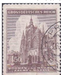
71. Марка Рейхспротекторат а Богемия и Моравия, Прага, собор Св.Вита, 1944г.