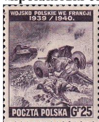
90.Марка Польши (Прав. в Лондоне) о боях во Франции, 1940г.