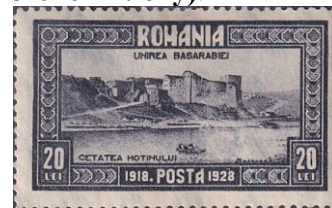
11. Марка Румынии, виды Бессарабии, 1928г.

Причиной таких действий Румынии были большие экономические проблемы и напряженная социальная обстановка в стране после поражения в Первой Мировой войне, что привело к появлению радикальных националистических организаций. В 1923 году одним из основателей LANC (Национальной Христианской Лиги), стал националист Корнелиу Кодряну. На парламентских выборах 1926 года НХЛ набрала 120 000 голосов и получила 10 мест в парламенте. В том же году Корнелиу Кодряну основал собственную националистическую организацию - «Легион Архангела Михаила», или «Железная Гвардия» (марка 8). Легион стал идеологическим противником LANC. Министр обороны Румынии с 1937 года Ион Антонеску установил сотрудничество с легионерами. Отношения Легиона с королём Каролем II ухудшались; в 1938 году он был распущен королем, а К. Кодряну убит. В апреле 1938 года был распущен парламент и установлена диктатура Кароля II (марка 9). В сентябре 1940 года Ион Антонеску привёл партию LANC к власти, назначив главу «Железной Гвардии» Хорию Сима вице-премьером Румынии. Однако в январе 1941 года после попытки путча, Антонеску при поддержке румынской армии разгромил «Железную гвардию», уничтожив её руководство и вынудив Хорию Сима сбежать в Германию.