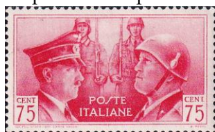
17.1. Марка Италии о содружестве с Германией, «Ось», 1941г.