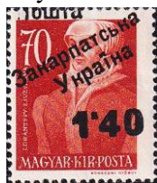
19. Марка Венгрии для Закарпатской Украины, 1943г.

Венгрия. Венгрия объявила войну СССР 27 июня 1941 года после бомбардировки советской авиацией венгерских населённых пунктов в ответ на оккупации части Западной Украины. Территориальных притязаний к СССР у Венгрии не было, мотивация – «месть большевикам за коммунистическую революцию 1919 года в Венгрии». Если не считать Закарпатскую Украину ,