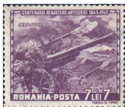
1. Марка Румынии, участие в захвате Крыма, 1943г.

Румыния. Румыния объявила войну СССР 22 июня 1941 года. Первые германские войска численностью 500 000 человек прибыли в Румынию ещё в январе 1941 года под предлогом защиты режима Антонеску от «Железной Гвардии». Также в Румынию был переведён штаб 11-й немецкой армии. В 3:15 утра 22 июня Румыния атаковала границу СССР. Страна вступила в войну на стороне Третьего Рейха за возвращение отнятых Советским Союзом земель. Столица Молдавской ССР пала 16 июля (марка 6), а 23 июля румынские войска вошли в Бендеры. Теперь вся Бессарабия и Буковина находились под контролем Румынии.