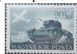
74. Марка Венгрии с чешскими танками и самолётами, 1941г.

года батальон был направлен на фронт (марка 73).. Таким образом, чехословацкий батальон стал первым иностранным военным формированием, вступившим в бой на стороне СССР на Восточном фронте. Они вывели из строя 30 225 военнослужащих противника, уничтожили 156 танков, 38 самолётов, 221 орудие, 274 автомашины и некоторое количество иной техники и оружия. Потери 1-го Чехословацкого корпуса составили свыше 11 тыс. военнослужащих погибшими.