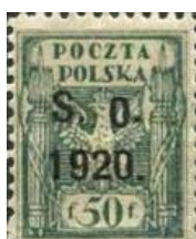
84.Марка Польши о плебисците, 1920г.