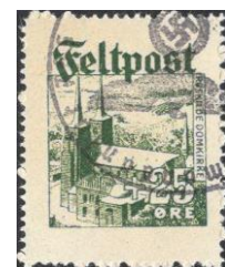
55. Марка Датского корпуса войск СС, 1941г.