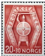
57. Марка Норвежского добровольческого легиона, 1941г.

Причиной таких действий Норвегии была в том, что добившись независимости от Швеции,