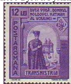
5. Марка Румынии для Транснистрии, Георгий Дука 17в., 1941г.