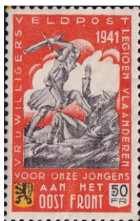
37. Марка Фламандского легиона войск СС, 1941г.