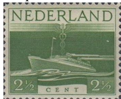
43. Марка Нидерландов. Военный выпуск в Лондоне, 1944г.