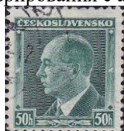
75. Марка Чехословакии, президент. Э.Бенеш, 1937г.

Причиной таких действий Чехословакии была проигранная Первая Мировая война Австро-Венгерской империей и её распад в том числе - образование Чехо-Словакии. Дальнейшая политика маневрирования с агрессивными соседями и помощью союзников привели к потере суверенитета.