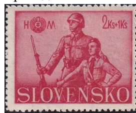
81.Марка Словакии для воюющих солдат Гвардии Глинки, 1942г.