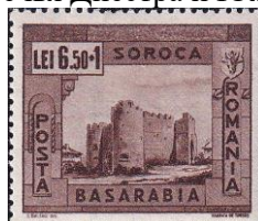
4. Марка Румынии для Бессарабского губернаторства, 1941г.