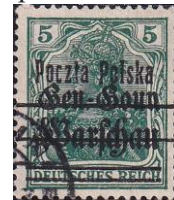
97.Марка Германского рейха для Польского временного правительства, 1918г.

Главногокомандующего Вооружёнными Силами СССР (всего за период Великой Отечественной войны было издано 373 благодарственных приказа и ещё 5 приказов были изданы за войну с