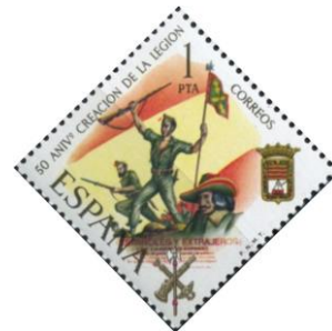
28. Марка Испании, к 50-летию Испанского легиона, 1971г.

Испания. Испания официально не объявляла войну СССР, однако организовала отправку на фронт одной добровольческой дивизии. Мотивация – месть за отправку Коминтерном Интербригад в Испанию во время гражданской войны. Ядром дивизии был Испанский легион, созданный в 1921 году (марка 28). В 1920-е годы легион участвовал в войне в Марокко, именно он инициировал в 1936 году восстание в африканских анклавах Испании Мелилье и Сеуте, перекинувшееся затем в Испанию. Легион принимал участие в подавлении выступлений шахтёров в Астурии в октябре 1934 года, а с 1936 года - в войне в Испании на стороне франкистов. Испанская дивизия (18 тысяч человек) была направлена генералом Франко (марка 29) на северный участок германо-советского фронта. С октября 1941 года воевала в районе Волхова, с августа 1942 – под Ленинградом (ныне Санкт-Петербург). В октябре 1943 дивизия была возвращена в Испанию, однако около 2 тысяч добровольцев остались воевать в Испанском легионе трёхбатальонного состава. Легион был расформирован в марте 1944, однако около 300 испанцев пожелали воевать дальше, и из них были сформированы 2 роты войск СС, воевавшие против Красной Армии до конца войны. В войне против СССР погибло около 5 тысяч испанцев , 452 испанца были взяты в советский плен. 2 испанца были награждены немецкими Рыцарскими крестами, в том числе один получил и Дубовые листья к Рыцарскому кресту.