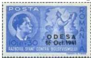
2. Марка Румынии для оккупированной Одессы в 1941г.

С конца октября 1941 части 3-й армии румынской участвовали в захвате Крыма совместно с немецкой 11-й армией под командованием фон Манштейна (марка 1). Румынская 4-я армия, с подкреплениями и союзными войсками численностью 340 тыс. чел. с начала августа 1941 вела операцию по взятию Одессы и после тяжёлых боёв Одесса 16 октября 1941 года была взята румынскими войсками (марка 2). Потери румынской 4-й армии в этой операции составили 29 тысяч погибшими и пропавшими, и 63 тысячи ранеными. Гитлер дал согласие на присоединение Бессарабии, Буковины и междуречья Днестра и Южного Буга к Румынии.