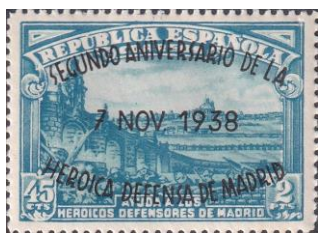
30. Марка Испанской республики, день взятия Мадрида фалангистами, 1939г.

Причиной таких действий Испании была уверенность в военных решениях своих проблем с помощью сомнительных союзников. Некогда могущественное Королевство Испания не смогло пережить несколько поражений в войнах с французскими, британскими и американскими соперниками и потерю почти всех своих многочисленных колоний, на эксплуатации которых строилась её экономика. После массовых выступлений 14 апреля 1931 года монархия была свергнута и Испания вновь стала республикой. Неспособность республиканской власти решить экономические проблемы без терроризма в стране привела к росту популярности армии Испанской Фаланги. Это привело к мятежу фалангистов в 1936 году и к развязыванию ими кровопролитной гражданской народной войны, с участием войнов-интернационалистов.