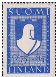
65. Марка Финляндии для легиона, 1941г.

30 июня 1941 года финские войска в составе 11 пехотных дивизий и 4 бригады, общей численностью около 150 тысяч человек (марка 65) перешли в наступление в направлении на