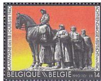
40. Марка Бельгии, к 50-летию битвы Бельгии с Вермахтом, памятник в Арденнах, 1990г.

в бригады войск СС - добровольческая бригада войск СС «Лангемарк» и добровольческая штурмовая бригада войск СС «Валлония» (марка 39). В октябре бригады, оставшиеся в прежнем составе (по 2 пехотных полка) были переименованы в дивизии.