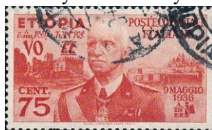
17.2. Марка колонии Италии Эфиопия, император Эфиопии Виктор-Эммануил III, 1938г.