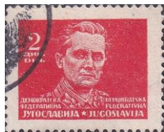
27. Марка ФНР Югослави, маршал Иосиф Броз Тито, 1945г.

К 15 мая 1945 года югославская армия партизан завершила освобождение Югославии. 2 марта 1945 года была образована федерация из шести социалистических республик - Демократическая Федеративная Югославия (марка 26), а 29 ноября 1945 года была провозглашена Федеративная Народная Республика Югославия во главе с хорватом и коммунистом Иосифом Броз Тито (марка 27).