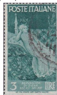
18. Марка Италии, провозглашение республики, 1946г.