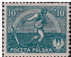
99. Марка Польши, к окончанию Советско-польской войны, 1922г.