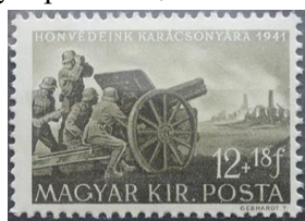
20. Марка Венгрии на рождество патриотов на Восточном фронте, 1941г.