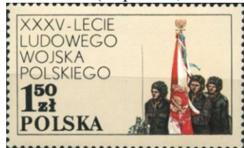
94. Марка Польши к 35-летию Войска Польского, 1978г.