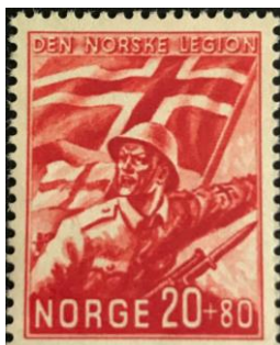
59. Марка Норвежской дивизии СС «Нордланд», 1941г.