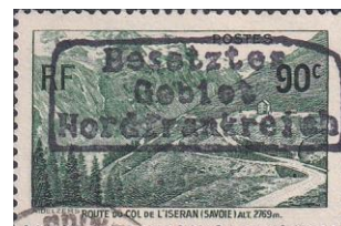
52. Марка Франции для оккупированных Дюнкерка и северной Франции, 1940г.

Промышленные круги были обеспокоены ростом влияния коммунистов и способствовали оттоку капитала из Франции, приведшее к обесцениванию национальной валюты, что свело на нет многие социальные программы правительства. После нападения нацистской Германии на Польшу Франция вместе с Великобританией 3 сентября 1939 года объявила войну Германии. В моральном и военном отношении Франция была совершенно не подготовлена к отражению германского нападения в мае 1940 года. В течение шести роковых недель Нидерланды, Бельгия и Франция были разгромлены, а британские войска изгнаны из континентальной Европы.