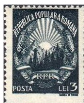
14. Марка Румынской Народной республики, провозглашение, 1945г.