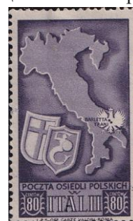
87.Марка Италии о польских боевых действиях, 1943г.