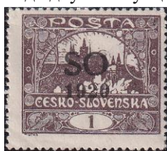
83.Марка Чехо-Словакии о плебисците, 1920г.