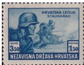
24. Марка Хорватии для легиона, воюющего в Сталинграде, 1942г.

Хорватия. На войну против СССР в июле 1941 года был отправлен «Итало-хорватский