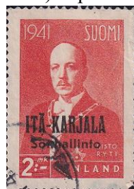
67. Марка Республики Финляндия для оккупированной Восточной Карелии, през.Р. Рюти, 1942г.