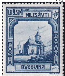
3. Марка Румынии для Буковинского губернаторства, 1941г.