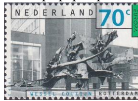
44. Марка Нидерландов, памятник бомбардировке Роттердама, 1993г.